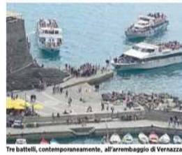
Tre battelli, contemporaneamente, all'arrembaggio di Vernazza